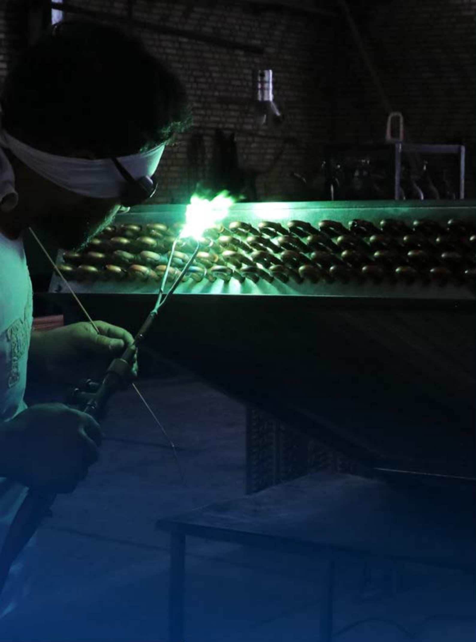
کیفیت دستور کار ماست